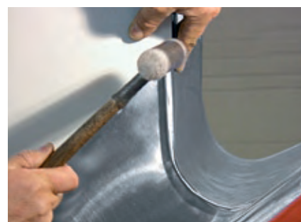
Doklepanie rąbka młotkiem plastikowym