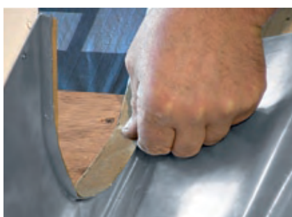
Przygotowanie połączenia klejonego