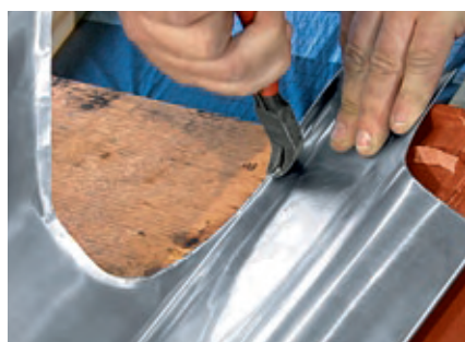
Przygotowanie rąbka kołnierza tylnego