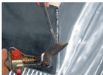
Lutowanie od strony okapu

na stronę www.rheinzink.pl w celu uzyskania szczegółowych informacji dotyczących miękkiego lutowania.