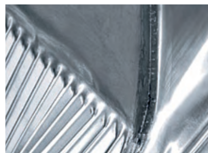
Wykończony szew lutowniczy