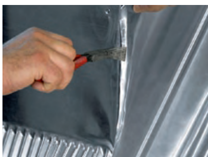
Przygotowanie rąbka pojedynczego