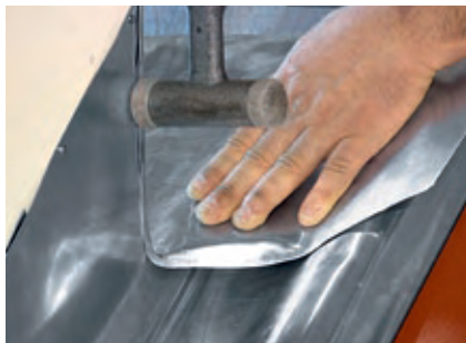
Połączenie kołnierza bocznego z fartuchem