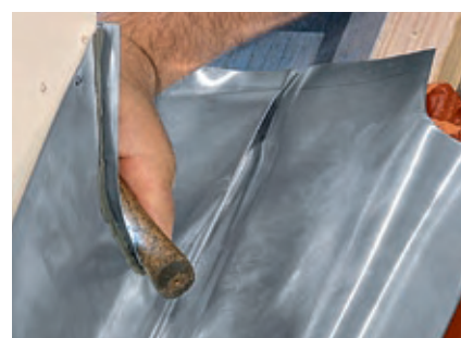
Zawijanie fartucha/kołnierza bocznego