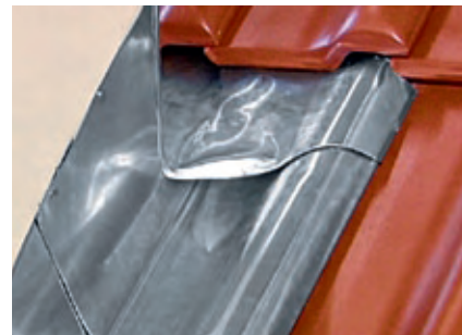
Gotowa obróbka od strony kalenicy