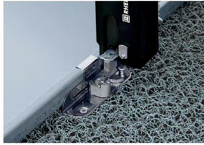
Montaż wysokich (H) łapek RHEINZINK CLIPFIX na strukturalnej warstwie rozdzielającej VAPOZINC i podłożu z OSB