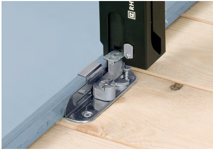
Montaż standardowych (ST) łapek RHEINZINK CLIPFIX na podłożu z desek