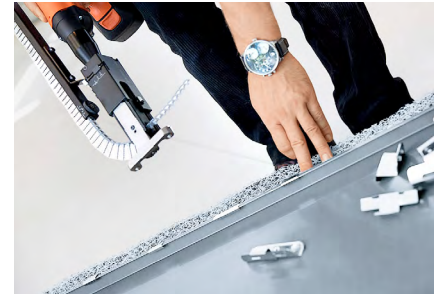
Zobacz wideo montażowe na stronie www.rheinzink.pl lub umów się na testy na swojej budowie